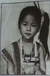
পৰম্পৰাগত পোছাকৰে কেমেৰাৰ সন্মুখত এগৰাকী কণমানি

মানুহৰ অহিত চিন্তিব নাপায়। সঁচাকৈয়ে ঈশ্বৰ জগতত বিৰাজমান হৈ আছে। সেইদিনাৰ পৰাই মৰমীয়ে বিকুক মৰম কৰে। যিহেতু তেওঁৰ ঘৰলৈ সন্মান আনিলে। সেইদিনাৰ পৰাই বিকুক নিজৰ সন্তানৰ দৰে মৰম কৰিবলৈ ল'লে।