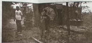
কালি নিশাৰ ভাগত অহা প্ৰচণ্ড ধুমুহাই বৈঠালাংছত কৰা ক্ষতিৰ এক দৃশ্য