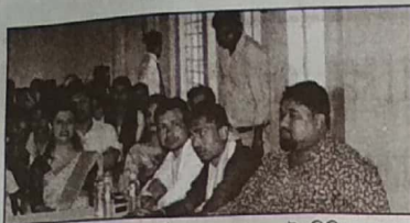
প্ৰবন্ধ জুবলি কলেজত অনুষ্ঠিত আলোচনা চক্ৰত উপস্থিতিৰ একাংশ